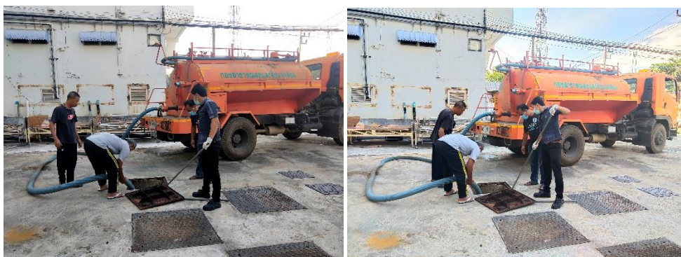
รูปที่ 2-6 รูปแสดงการสูบน้ำจากถังเกรอะ