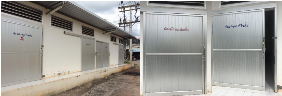
รูปที่ 2-7 รูปแสดงห้องพักขยะ