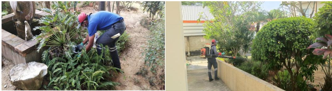
รูปที่ 2-15 รูปการพ่นยากำจัดยุงและการวางกับดักเพื่อกำจัดยุง