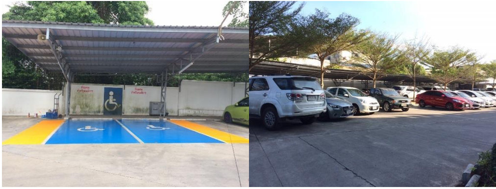
รูปที่ 2-14 รูปแสดงที่จอดรถคนพิการ