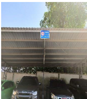
รูปที่ 2-2 ป้ายดับเครื่องยนต์