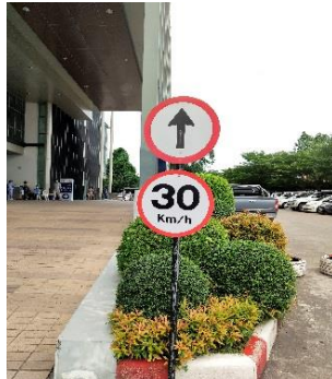
รูปที่ 2-3 เจ้าหน้าที่ รปภ.ประจำบริเวณทางเข้า-ออกและป้ายจำกัดความเร็ว