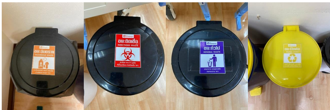
รูปที่ 2-8 รูปแสดงถังขยะในโรงพยาบาล