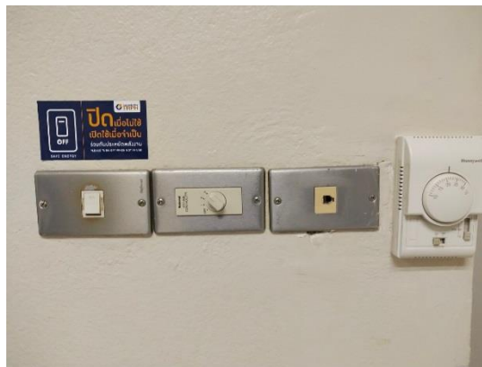
รูปที่ 2-10 มีการติดตั้งเกอร์ประหยัดพลังงาน