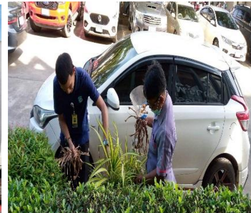
รูปที่ 2-1 การจัดตกแต่งพื้นที่สีเขียว