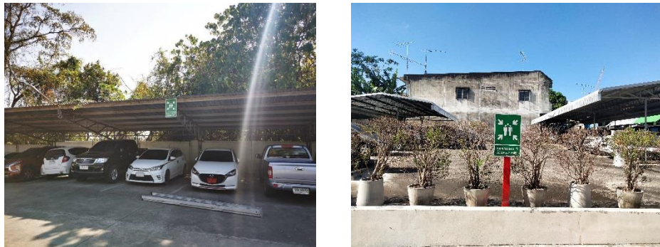
รูปที่ 2-12 รูปแสดงจุดรวมพล