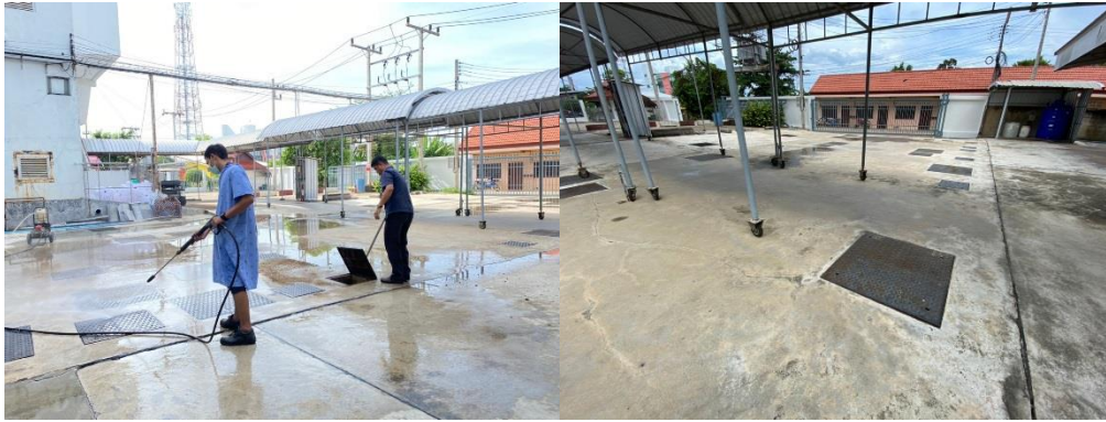
รูปที่ 2-4 รูประบบบำบัดน้ำเสียของโรงพยาบาล