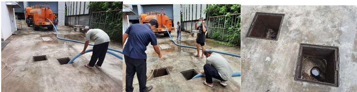
รูปที่ 2-5 รูปการสูบน้ำออกจากบ่อดักไขมัน