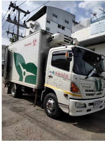
รูปที่ 2-9 มีการจัดเก็บขยะติดเชื้อสัปดาห์ละ 2 วัน