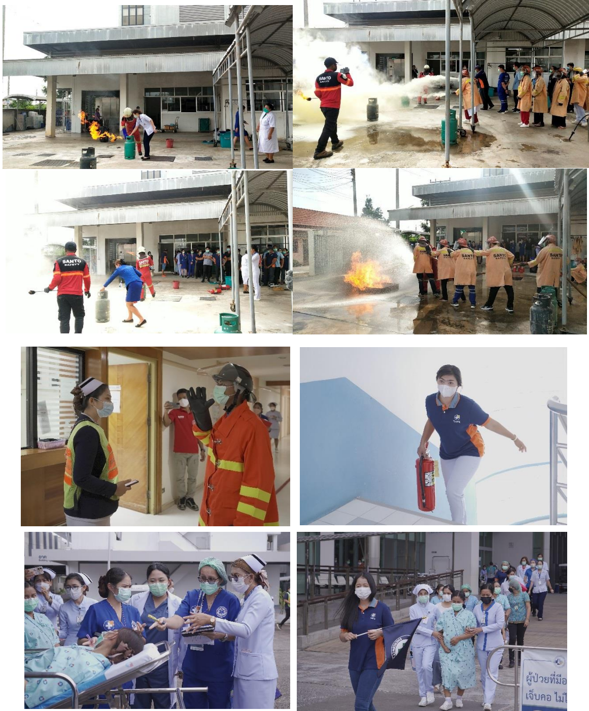
รูปที่ 2-13 รูปแสดงการซ้อมดับเพลิงขั้นต้นและอพยพหนีไฟ